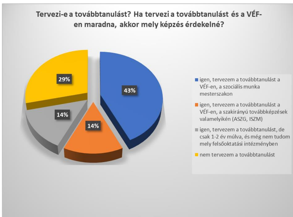
3. sz. ábra

felsőoktatási intézményben folytatnák tanulmányaikat. Négy hallgató szeretné felsőfokú tanulmányait a Veszprémi Érseki Főiskolán, az alma materben folytatni. Hárman a szociális munka mesterszakon, míg egy hallgató valamelyik szakirányú továbbképzési szakon, vagy az Alkalmazott szociális gerontológia, vagy az Iskolai szociális munka szakirányon. Kettő fő egyáltalán nem tervezi tanulmányai folytatását, míg egy fő bizonytalan e téren, terve szerint 1-2 év elteltével folytatja majd a felsőfokú tanulmányait (3. sz. ábra).