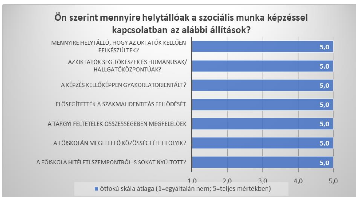
2. sz. ábra

A felmérés második fő területével összefüggésben a kérdőív tartalmazott három nyitott kérdést, melyek keretében a diákok a képzés erősségeit, gyengeségeit sorolhatták fel, illetve a képzés minőségének javítása érdekében fejlesztési javaslatokat fogalmazhatták meg.