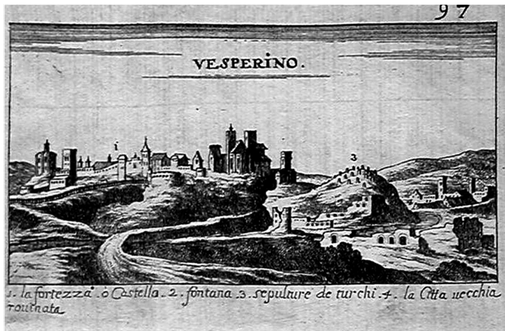
Veszprém várának látképe, metszet 1613-ból