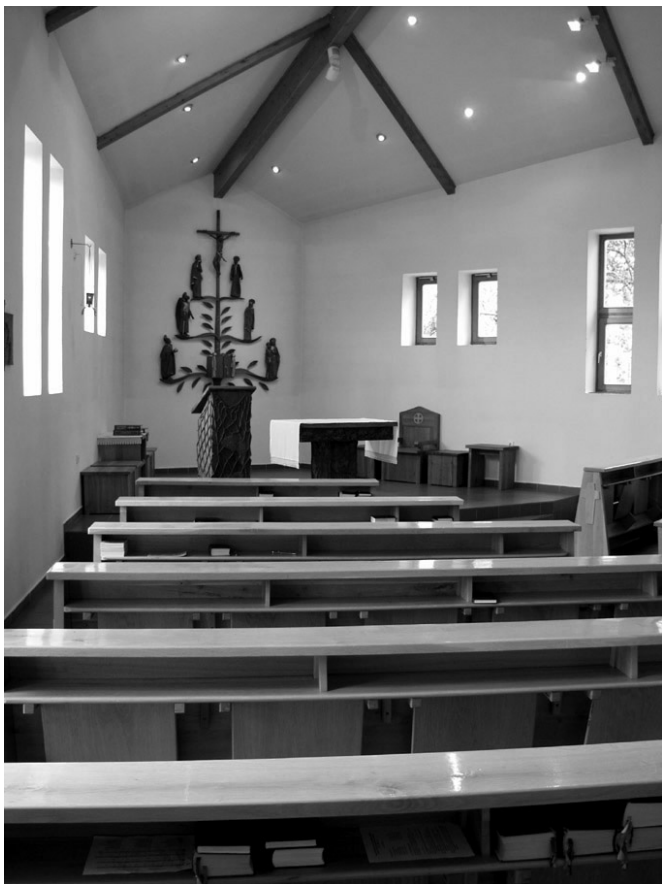
A Boldog Gizella Szeminárium kápolnája