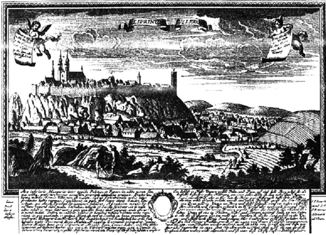
Veszprém látképe a XVIII. században (Johann Christian rézkarca)